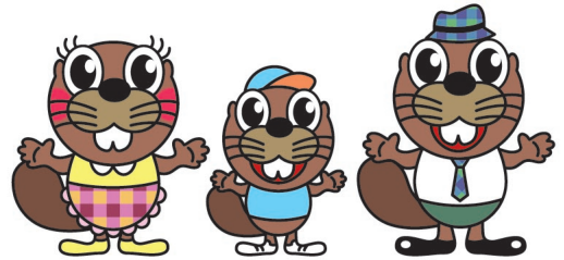
（建設職能国保組合イメージキャラクター）