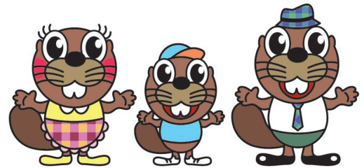
(建設職能国保組合イメージキャラクター)