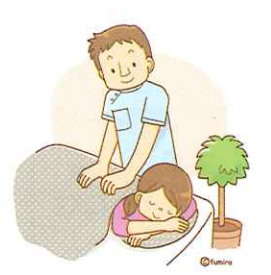
慰安的なマッサージはX

任をすることで、患者に代わって柔道整復師から保険者に直接請求できる仕組みだ。『マッサージの上手い接骨院』という評判を聞きつけて集まった患者を困り込み、健康保険が利く病名をつけて請求を続け、県などの聞き取りや立ち入り調査で事実が判明し、県から受領委任の取扱を中止される接骨院が後を絶たない。ケガの基準が曖昧な上に、施術者側には、ケガの痛みを訴える患者を整