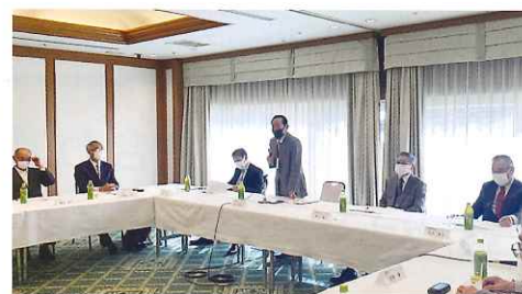
2月17日に開催された理事会の様子(アルカディア市ヶ谷)