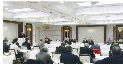
組合会の様子 (ホテルグランドヒル市ヶ谷)