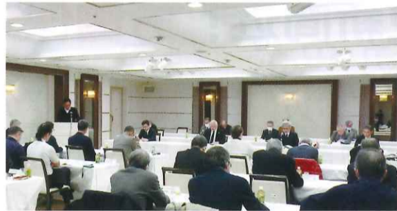
組合会の様子 (ホテルグランドヒル市ヶ谷)