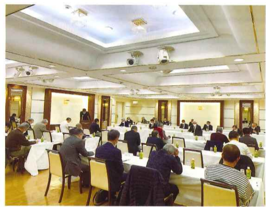
組合会の様子 (ホテルブランドヒル市ヶ谷)